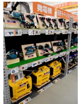
レンタルコーナー