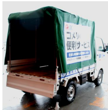
トラック貸出サービス