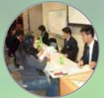
左 助成団体による制度の説明 右 個別質問会のようす