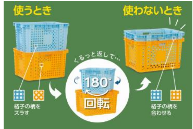
開発商品 (コンテナα)