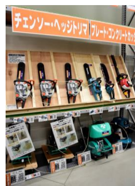
レンタルコーナー①