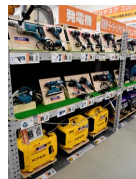
レンタルコーナー②