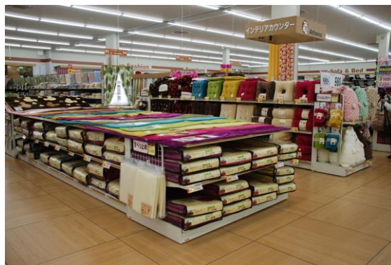
ラグ・クッション売場