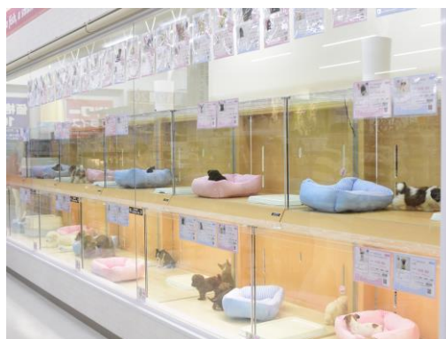
ペットアミ（生体販売）