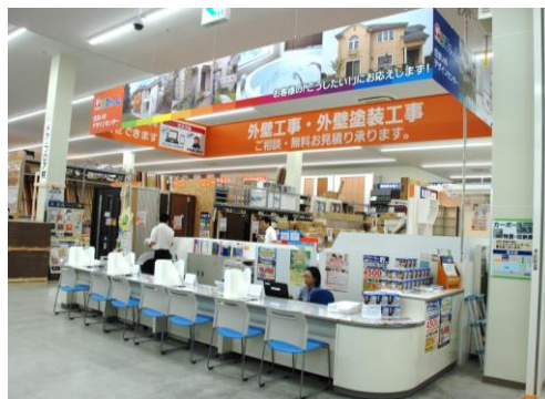
デザインセンター