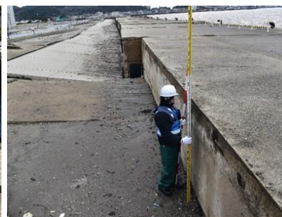
港湾被災状況調査