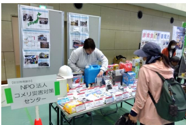
訓練：防災用品の展示