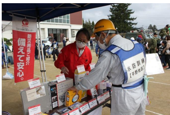
訓練：防災用品の展示