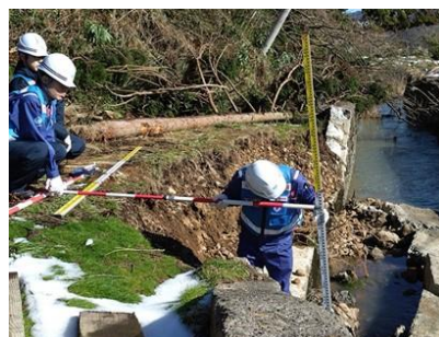
河川被災状況調査