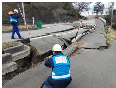
道路被災状況調査